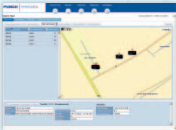
Track & trace: realtime visualisatie van uw voertuigen op kaart