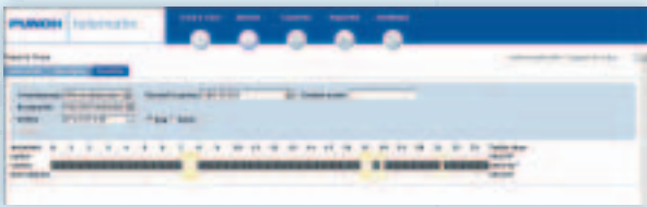
Tijdslijn: visualisatie van de activiteiten op dag- of weekbasis

berekent de CarBox het aantal afgelegde kilometers op basis van de snelheidspuls van het voertuig. De registratie wordt dus niet beïnvloed door eventuele storingen in het gps-signaal . Kilometer teller en CarBox zijn gesynchroniseerd zodat verwarring en discussies uitgesloten zijn. Elke chauffeur meldt zich aan met een identificatiesleutel(*) en door middel van een eenvoudige schakelaar bepaalt hij of een rit zakelijk of privé is. Naast de gereden kilometers, worden ook de reis- en werkuren automatisch geregistreerd .