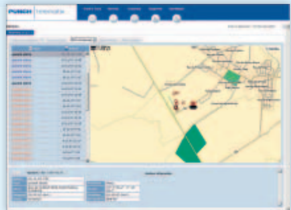
Grijp in via alarmsignalen

ingrijpen, ook als u niet ingelogd bent!